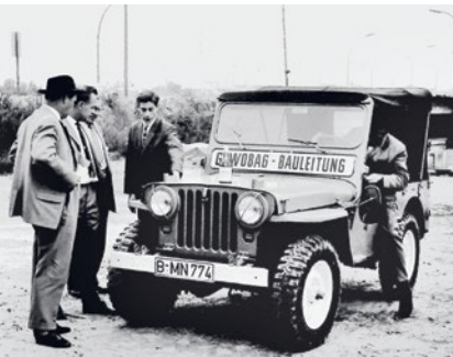
MOBIL VOR ORT: Anfang der 1960er Jahre führen Gewobag-Mitarbeitende mit dem Jeep über die sandigen Wege der Großbaustellen.

Der Begriff „New Work“ ist heute in aller Munde. Doch was heißt das eigentlich? Bei der Gewobag verstehen wir darunter sowohl tarifrechtlich gut abgesicherte Arbeitsplätze als auch zukunftsweisende Modelle der Zusammenarbeit. In unserem internen „City Campus“ vernetzen wir Mitarbeitende und Teams aus den unterschiedlichen Konzernbereichen. Gemeinsam kommen wir so auf innovative Ideen, wie wir unsere Dienstleistungen, unser Unternehmen und unsere Stadt noch besser machen können.